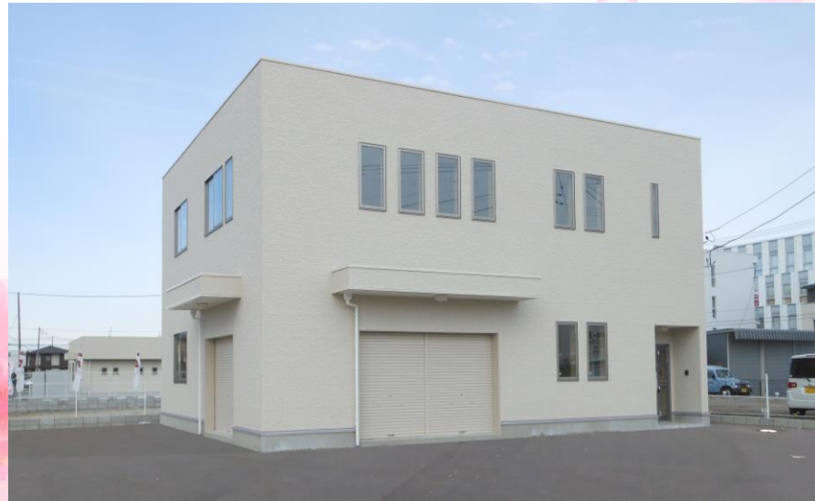
敷地面積: 442.82㎡ (133.95坪) 建物面積: 236.82㎡ (71.63坪) (1階・2階各: 118.41㎡ (35.81坪))