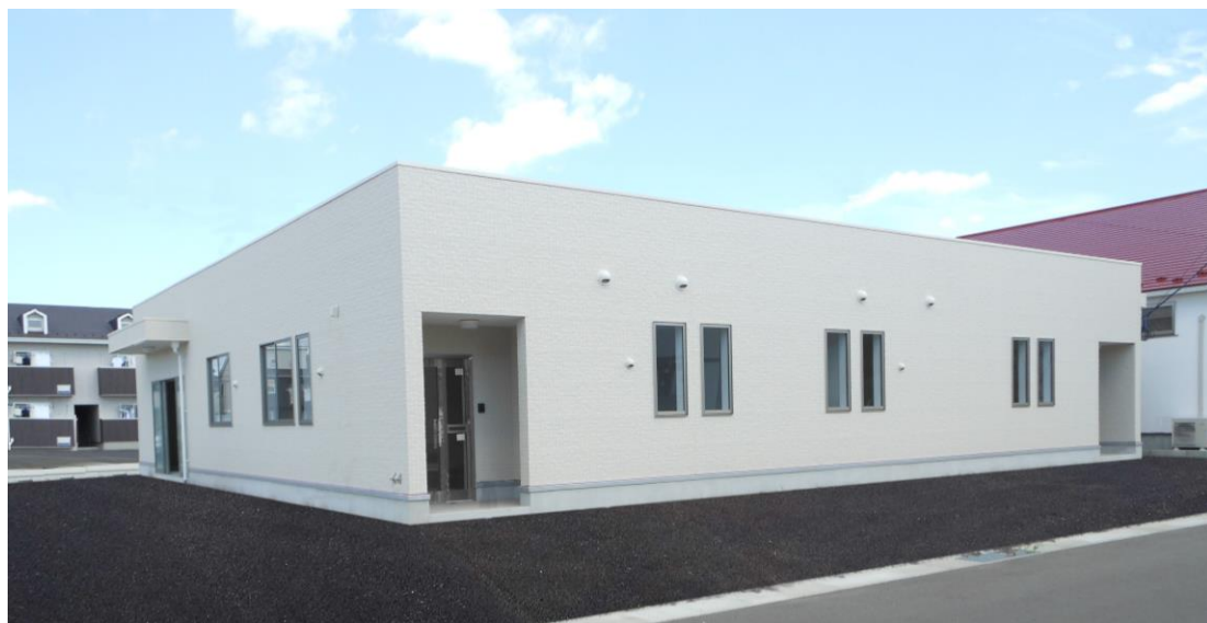
敷地面積:664.79㎡(201.09坪) 建物面積:301.68㎡(91.25坪) (テナントA:183.83㎡(55.60坪) テナントB:117.84㎡(35.64坪))